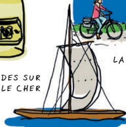
LES BALADES SUR LA LOIRE ET LE CHER