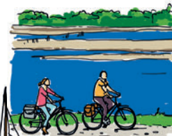
LA LOIRE À VÉLO