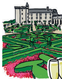
LE CHÂTEAU DE VILLANDRY ET SES JARDINS