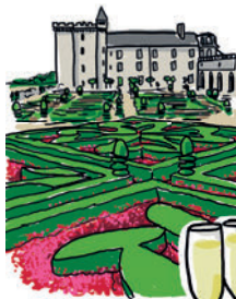
LE CHÂTEAU DE VILLANDRY ET SES JARDINS