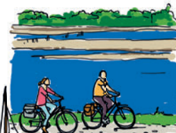
LES BALADES SUR LA LOIRE ET LE CHER