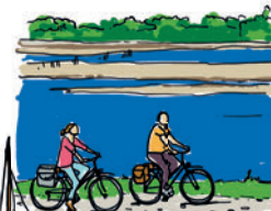
LA LOIRE À VÉLO