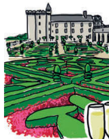
LE CHÂTEAU DE VILLANDRY ET SES JARDINS