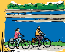
LA LOIRE À VÉLO